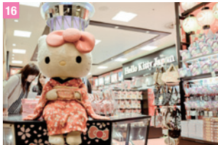
16 Hello Kitty Japan 墨田・兩國

東京都墨田區押上 1-1-2 (Solamachi 商場 6F) 圖 10:00 ~ 21:00 圖 03-5610-7228 圖 http://www.san-x.co.jp/