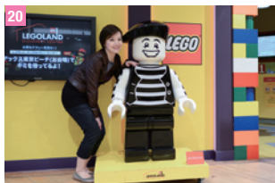
20 LEGOLAND® Discovery Center Tokyo 台場

TOKYO CRUISE 圖 淺草 ~ 台場 圖 10:00 ~ 18:40 圖 0120-977-311 圖 http://www.suijobus.co.jp/