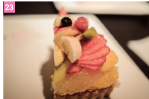
23 Café comme ca 新宿

東京都墨田區押上 1-1-2 (Solamachi 商場 6F) 圖 10:30 ~ 23:00 圖 http://rokurinsha.com/