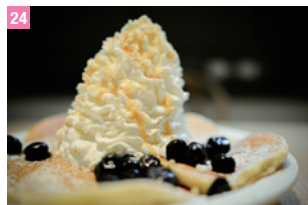
24 Eggs'n Things 澁谷・原宿

東京都新宿區新宿 3-26-6 (comme ca store 新宿店 5F) 圖 平日 12:00 ~ 22:30、假日 12:00 ~ 19:30 圖 03-5367-3113 圖 http://www.cafe-commeca.co.jp/