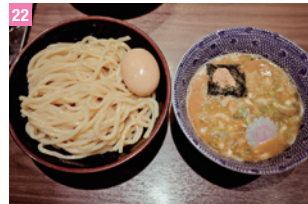
22 六厘舍 墨田・兩國

MINATOYA 食品本店 圖 上野二木的菓子斜對面 圖 11:00 ~ 售完為止