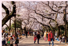
圖 http://museum.guidenet.jp/ (日文)

說到上野，在春天是有名的賞櫻地點，但上野也是日本首屈一指的藝術特區。在 JR 上野站前的上野恩賜公園附近、谷中、根津、千駄木一帶，以東京國立博物館為首，聚集了許多美術館、博物館、小型博物館等。此外因為還有以熊貓聞名的上野動物園，所以在上野逛一整天也不會膩哦。