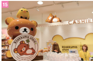
15 RILAKKUMA STORE 東京