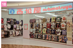
18 西松屋 台場

東京都港區六本木 6-10-1 圖 10:00 ~ 23:00 圖 03-6406-6652 圖 http://www.roppongihills.com/tcv/en/