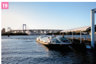
19 搭船/台場海濱風景 台場

東京都港區台場 1-6-1 (DECK'S 4F) 圖 11:00 ~ 21:00 圖 03-3599-5365 圖 http://www.24028.jp/