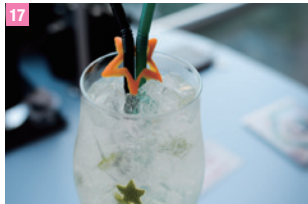
17 Tokyo City View 六本木

東京都墨田區押上 1-1-2 (Solamachi 商場 4F) 圖 10:00 ~ 21:00 圖 03-5610-2926 圖 http://www.sanrio.co.jp/chinese-tw/index.html