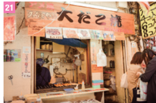
21 章魚燒 上野

東京這麼大，好吃、好玩、好逛、好買的推薦實在是太多了，真的要仔細玩透透，去一個月都不夠！除了前面推薦給大家的路線外，Vera 還有好多口袋名單，等不及要蹦出來，像 TOKYO SKYTREE® 內超可愛的卡通人物專賣店、六本木 Tokyo City View 的 52 樓高樓美景、媽媽必逛的西松屋、帶小孩必玩的 LEGOLAND，以及各地不吃不行的美味料理……想介紹的太多了，前面來不及提到的，後面統統一次補上！